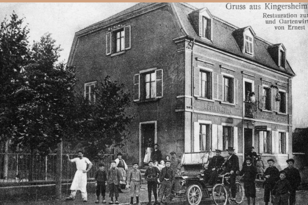
Gruss aus Kingersheim, O.-Els. Restauration zur Krone und Gartenwirtschaft von Ernest Ott

Deux moyens de locomotion devant le restaurant Ott, rue Principale (l'un des nombreux bistrotts que comptait la commune) et qui est l'actuelle boulangerie Lidolf rue de Hirschau.