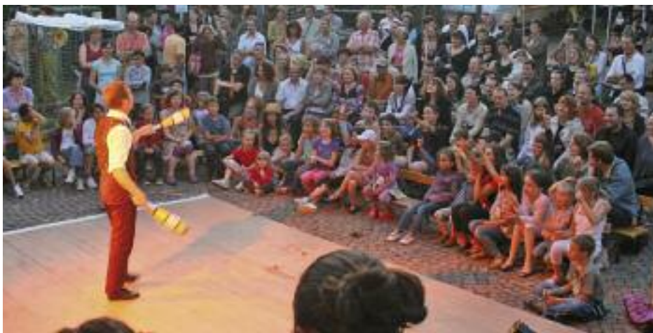
Une manifestation urbaine pour fêter l'an neuf, dans l'esprit des spectacles de rues estivaux