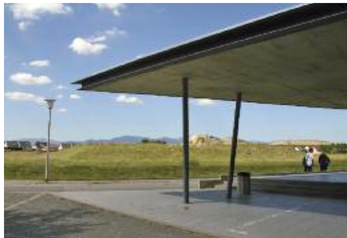
Une plaine de foot à l'Espace Gounod

Le projet de plaine de foot à l'Espace Gounod fait également l'objet d'une procédure de concours en vue de la sélection d'une équipe de maîtrise d'œuvre. C'est le projet soutenu par l'équipe du cabinet d'architectes Santandrea-Rapp-Fellmann qui a été retenu par le Conseil Municipal, sur proposition du jury créé pour l'occasion.