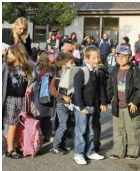
Des élèves ravis de retrouver les bancs de l'école

Concernant le périscolaire, les enfants des écoles maternelles des Perdrix et Louise Michel sont respectivement accueillis, midi et soir, à la Coccinelle et à la Maison de la petite enfance. Les élèves de maternelle de l'Espace éducatif Gounod restent quant à eux dans les locaux de l'école. Les élèves de primaire de l'Espace éducatif du Centre, des Perdrix et de l'Espace éducatif Gounod bénéficient eux aussi d'un service périscolaire sur place. Quant aux élèves du CE1 au CM2, ils continuent à déjeuner à la cantine du Collège Joliot-Curie et peuvent s'adonner à de multiples activités, après les cours, dans leur établissement. L'inscription au périscolaire est à renouveler tous les ans. Elle se fait généralement au courant du mois de mai (avec possibilité d'ouverture de dossier en amont auprès des écoles). Pour plus d'in-