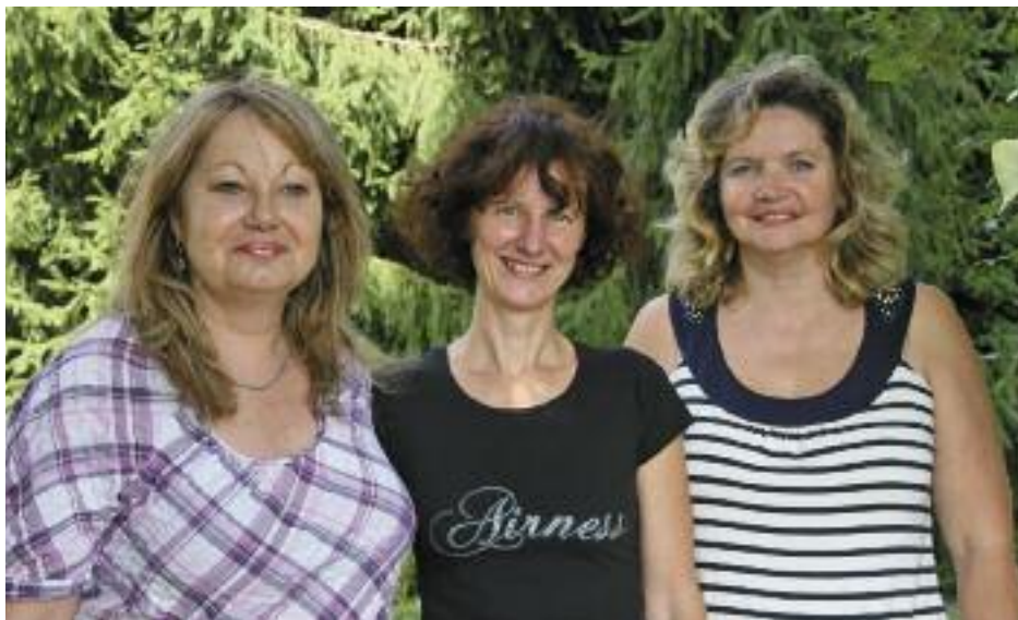
Une équipe au service des écoles, des familles et des associations

Le service assure également la gestion et le suivi administratif des commissions, ateliers et conseils participatifs en lien avec le secteur enfance. Parmi ceux-ci, le comité de pilotage Ville-Ecole qui permet