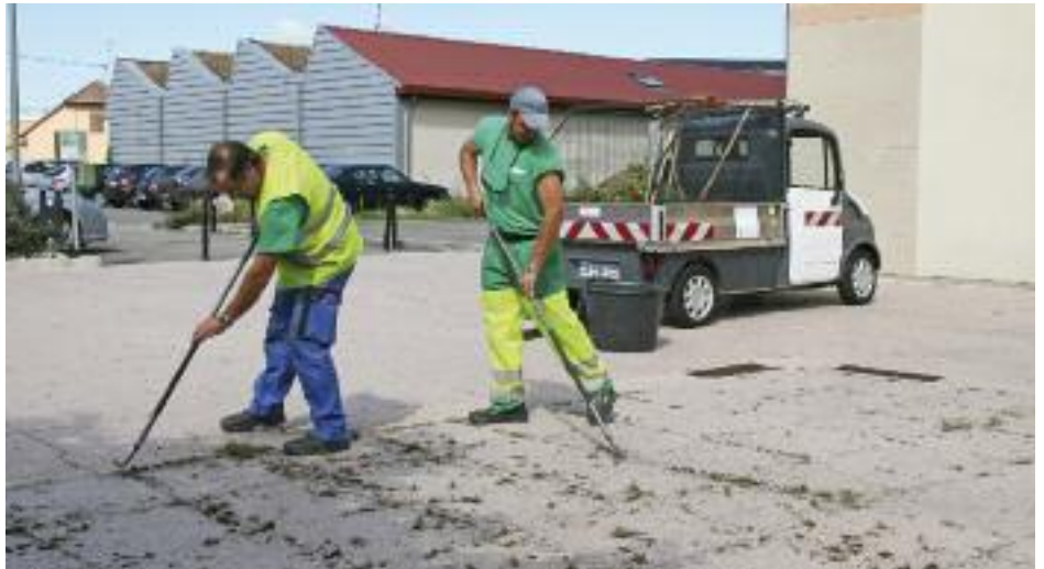
Deux agents ont été recrutés pour effectuer le désherbage manuel de la ville

Les prairies naturelles et fleuries ne nécessitent pas d'arrosage spécifique et sont tondues seulement deux fois par an. Dans un même ordre d'idées, le service a reconduit l'utilisation de techniques alternatives aux pesticides et économes en eau pour le fleurissement de la ville (plus spécifiquement rue Botticelli et sur le par-