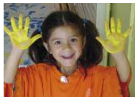
Les animations d'été sont l'occasion de découvrir les arts plastiques !

musical, danse orientale, athlétisme, tir à la carabine... L'occasion de se faire plaisir en s'adonnant à son loisir préféré ou de se découvrir de nouvelles passions ! Comme chaque été, les adolescents de 12 à 18 ans se sont retrouvés au Village Jeunes à l'Espace Gounod, autour d'animations, de stages, d'ateliers et de minis-séjours. Une série d'activités déclinée