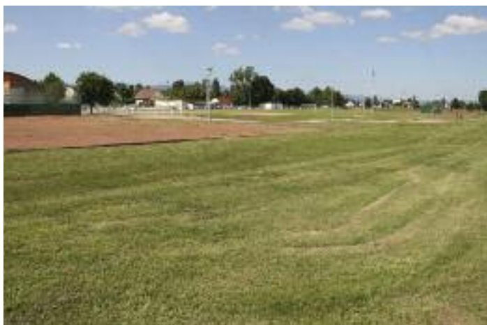
Le stade Jules Rimet, sur lequel sera aménagé le futur parc public