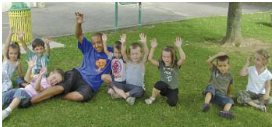
Les loisirs d'été ont connu un vif succès : les enfants en redemandent !

Avec les animations été, les enfants et les adolescents de 4 à 18 ans ont eu l'occasion de s'adonner, tout au long d'une semaine, au stage de leur choix. Le Créa et les associations locales leur avaient concocté une palette d'activités, aussi variées qu'originales : équitation, conte