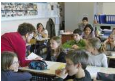
Rencontre intergénérationnelle à l'Ecole du Centre

Le soutien de la Ville aux associations se traduit également par un subventionnement adapté et équitable, dont le service assure et améliore le suivi, en lien étroit avec l'OMS et le CCVA. Le service s'implique enfin fortement dans l'organisation d'événements tels que la cérémonie du bénévolat associatif, ou plus récemment, de la promenade intergénérationnelle dans la forêt du Nonnenbruch, proposée par l'Atelier sport ■