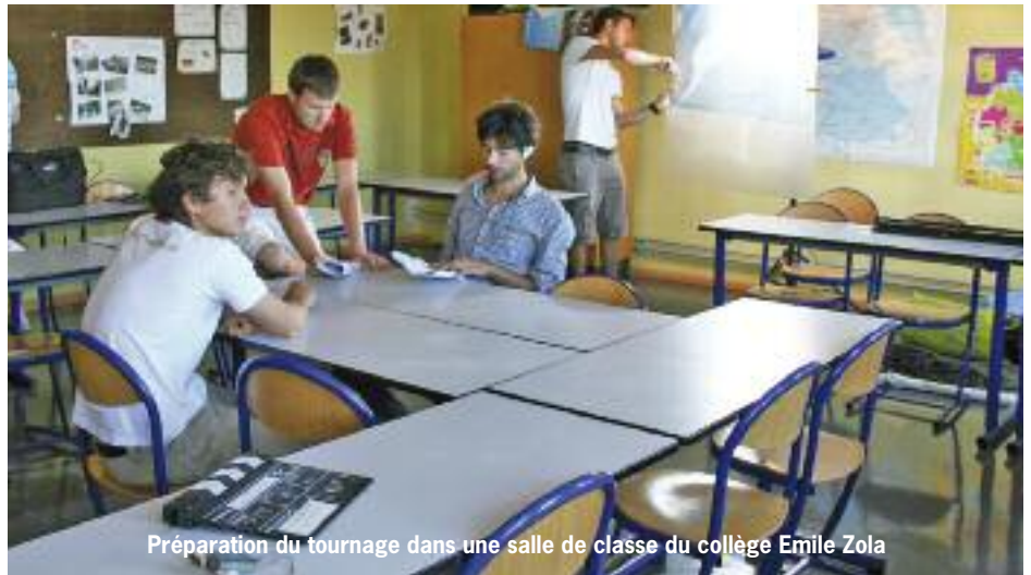
Préparation du tournage dans une salle de classe du collège Emile Zola