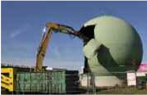
Démolition de la Boule Verte

embellir - améliorer - entretenir - réparer - aménager - transformer - nettoyer - sécuriser - équiper - installer - rénover - restaurer