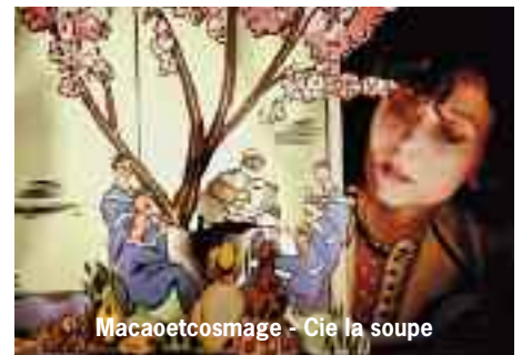
Macaoetcosmage - Cie la soupe