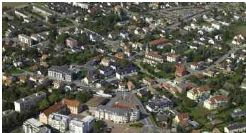
L'expertise des habitants au service de l'avenir de la Ville

Le travail du conseil participatif s'organisera en ateliers thématiques (aménagement du centre-ville, formes urbaines, espaces naturels, économie, services...) qui s'échelonneront tout au long du premier semestre 2011. Afin de favoriser