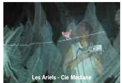
Les Ariels - Cie Mediane