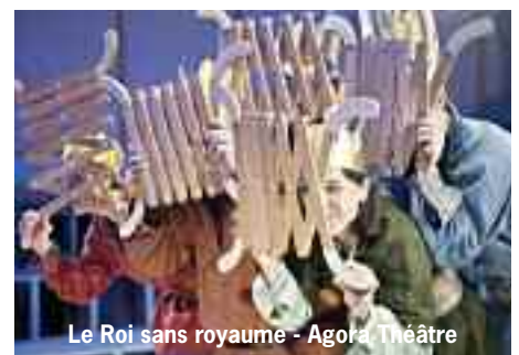
Le Roi sans royaume - Agora Théâtre