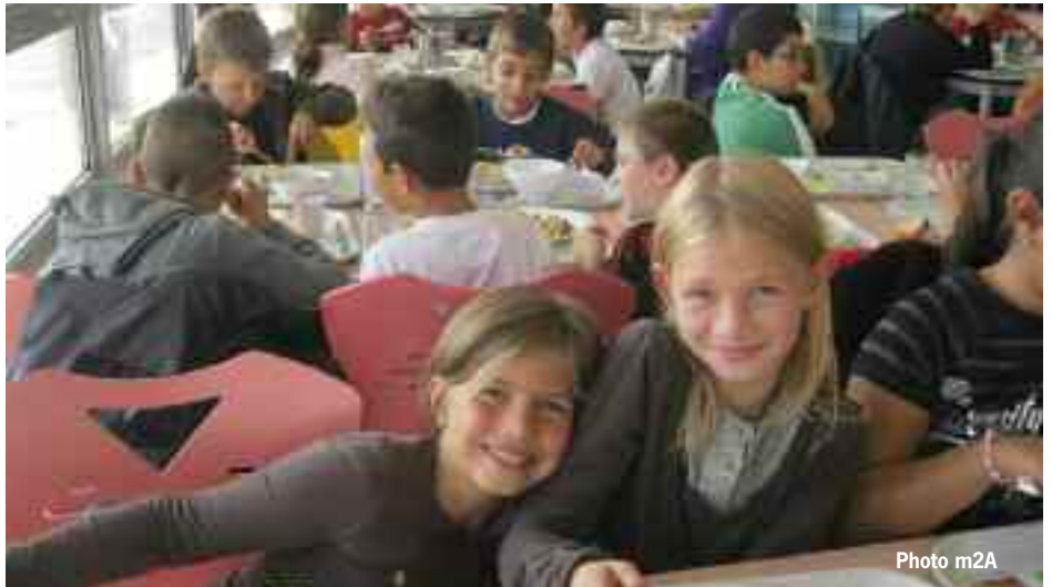
Parmi la palette de propositions faites par l'agglomération en matière de périscolaire, un dispositif de restauration de choix