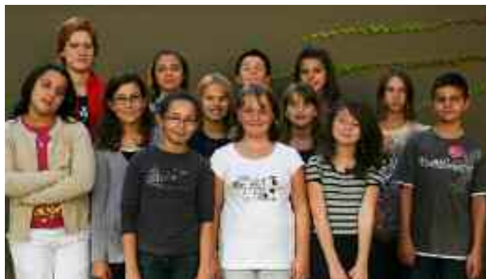
L'équipe 2010-2011 du Conseil Municipal des Enfants