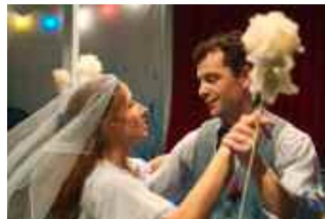
Le Cheval de Bleu, une invitation à découvrir le spectacle jeune public

Et parce qu'il est essentiel que tous les seniors puissent participer aux sorties, le Conseil Communal d'Action Sociale (CCAS) de la Ville de Kingersheim apportera dès 2011 son soutien, à hauteur de 25, 50 ou 75 %, aux personnes perce-