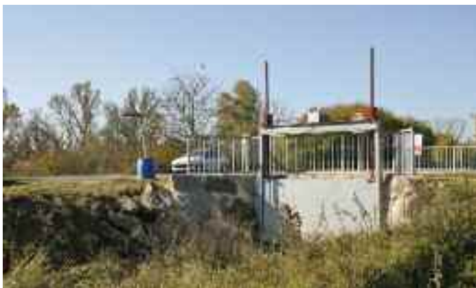
Kingersheim assurera la commande et l'entretien de la vanne du chenal de décharge

Le Dollerbaechlein est l'exutoire de nombreux déversoirs d'orage tout au long de son cours. Cette situation pouvant entraîner de fortes crues, le Syndicat Intercommunal du Dollerbaechlein a décidé la création d'un chenal de décharge vers l'III. Afin d'éviter, en cas de crue, un transfert de l'III vers le Dollerbaechlein, une vanne a également été installée. Le 22 septembre 2010, le Conseil Municipal a été invité à adopter les termes d'une convention entre la Ville, le Syndicat à vocation unique du Dollerbaechlein et le Conseil Général ayant pour but de fixer les modalités d'entretien et de manipulation de cette vanne : l'ouverture/fermeture et le graissage des crics incombant à la commune du 1 er janvier au 15 octobre ■