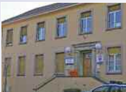
Le CRA installé à Tival

Avec la création du CRA, la Ville ne cherche pas seulement à rationaliser l'occupation de ses locaux et à rassembler les associations disséminées dans la commune. Plus que tout, elle veut donner aux associations les moyens de cultiver leur dynamisme au quotidien, en les aidant à se fédérer, en répondant à leurs besoins dans le cadre de l'organisation de projets ou de manifestations et surtout en leur donnant les moyens de développer encore leur investissement par l'enrichissement de leurs compétences ■