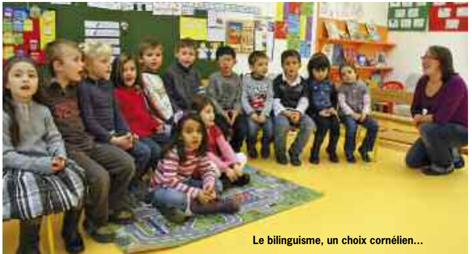
Le bilinguisme, un choix cornélien...