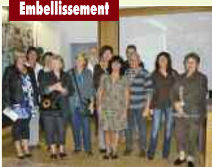
Photo de famille, le 7 octobre , pour les heureux gagnants du traditionnel concours des "maisons et balcons fleuris".