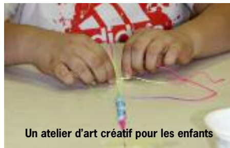
Un atelier d'art créatif pour les enfants

Par ailleurs, un partenariat signé l'année dernière avec la Fondation Cultura offre aux usagers un véritable "accès privilégié" à la culture. Des ateliers de bricolage dont le thème est généralement fonction des saisons, des moments de fête, des