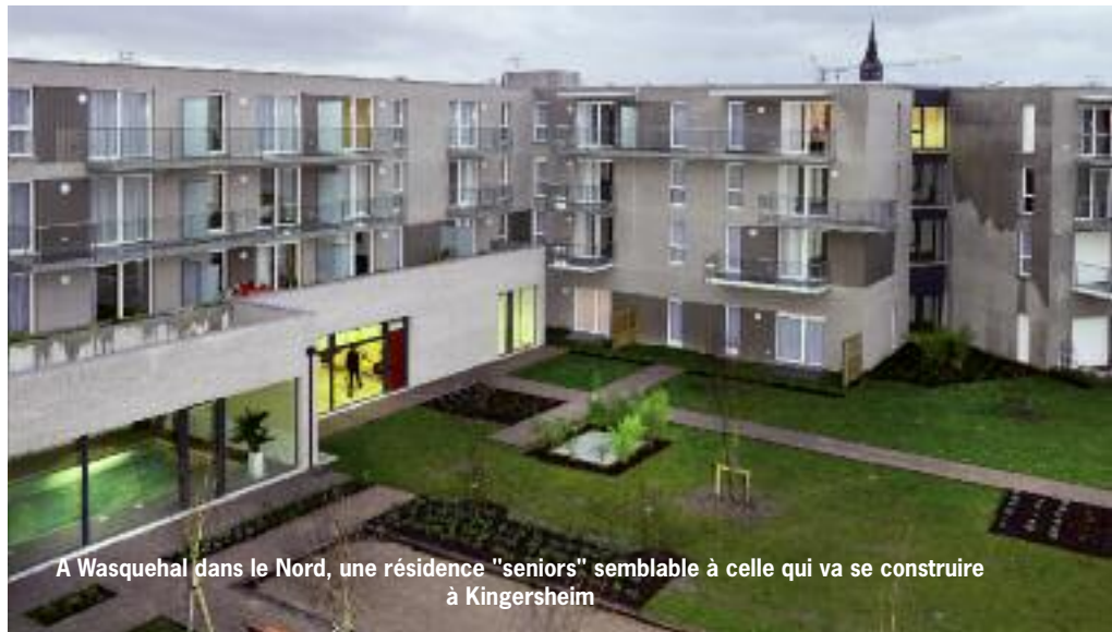
A Wasquehal dans le Nord, une résidence "seniors" semblable à celle qui va se construire à Kingersheim

Ainsi, le PADD construit avec les habitants s'attache à préserver la particularité kingersheimoise, notamment l'identité "village" du centre historique tout en ouvrant de nouvelles opportunités dans des lieux stratégiques. En ce sens, un grand centre vert - et nouveau pôle géographique - se profile à l'espace Pierre de Coubertin avec le Parc des Gravières qui ouvrira au printemps prochain (Kingersheim Magazine n° 106). Un autre enjeu est celui du maintien de la population. En effet, face à une démographie relativement positive mais qui souffre quand même d'un fléchissement des flux migratoires, Kingersheim est aujourd'hui en concurrence avec les