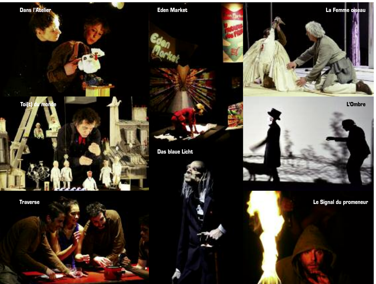
Des spectacles et des animations à foison tout le long du festival

mation dédiée à la beauté de la création artistique et aux émotions pures. Proposant des spectacles à foison, ici dans les salles communales mais aussi ailleurs dans d'autres lieux culturels "phares" de la région (La Filature à Mulhouse, La Passerelle à Rixheim, Le Triangle à Huningue...). Fidèle à ses valeurs de partage et d'ouverture, le festival a mis un point d'honneur à continuer à émerveiller tous les publics ■