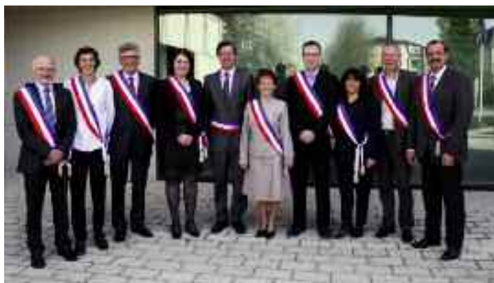
Le Maire et les 9 adjoints qui composent la nouvelle municipalité.