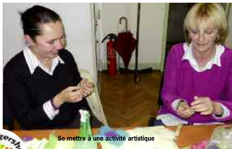
Se mettre à une activité artistique