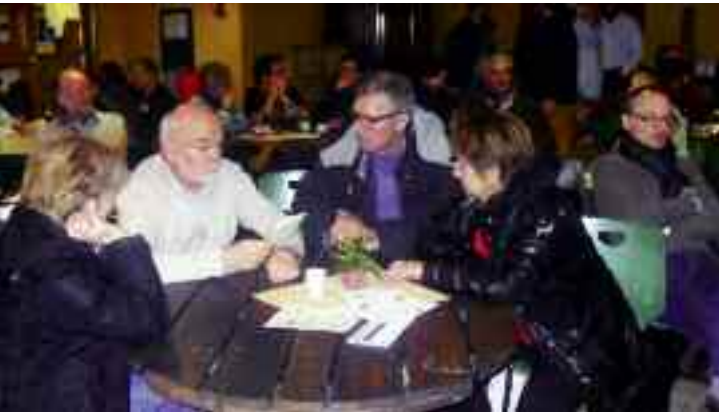
Ecologie : le 19 février à la salle des Banquets, l'association les Sheds proposait une soirée projection-débat portant sur les enjeux de l'agriculture bio.