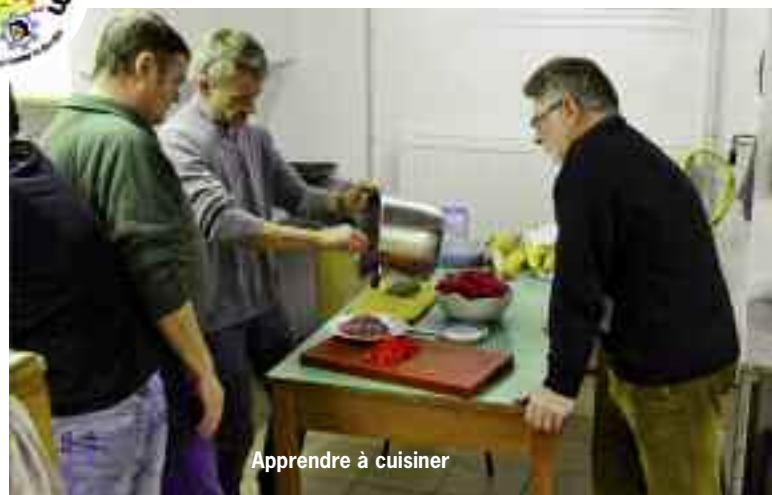
Apprendre à cuisiner