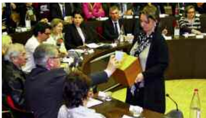
Les élus du Conseil municipal élisent le Maire et les adjoints.