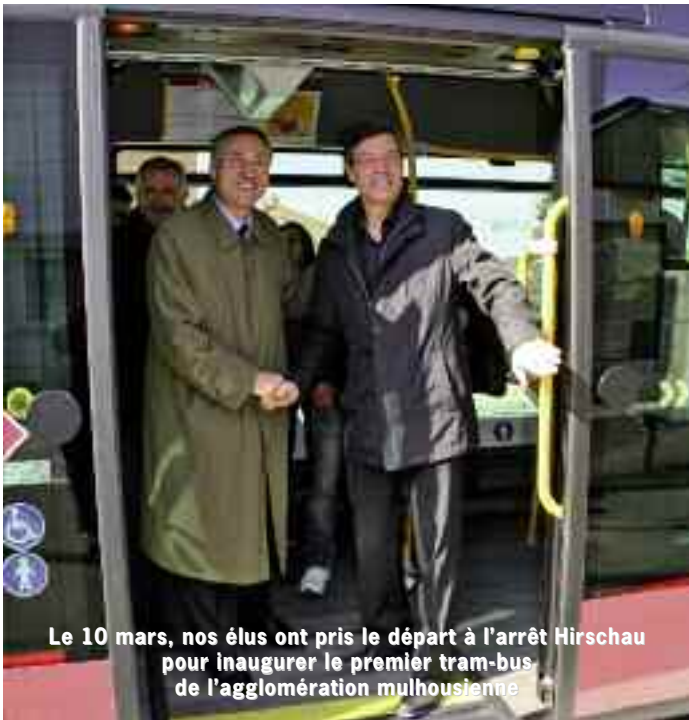
Le 10 mars, nos élus ont pris le départ à l'arrêt Hirschau pour inaugurer le premier tram-bus de l'agglomération mulhousienne

Au nombre de 5, les premiers véhicules nouvelle génération de l'agglomération mulhousienne commencent à circuler sur la ligne 4 du réseau Soléa. Performante et attractive, cette ligne a permis d'améliorer considérablement le service de transport proposé aux habitants de Kingersheim. Les premiers résultats de fréquentation sur l'axe le prouvent.