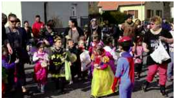
Ecoles : le 14 mars, c'était au tour des maternelles des Tilleuls de se déguiser et de s'amuser pour fêter le carnaval.