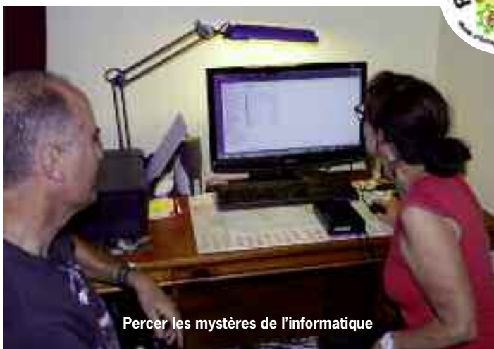
Percer les mystères de l'informatique