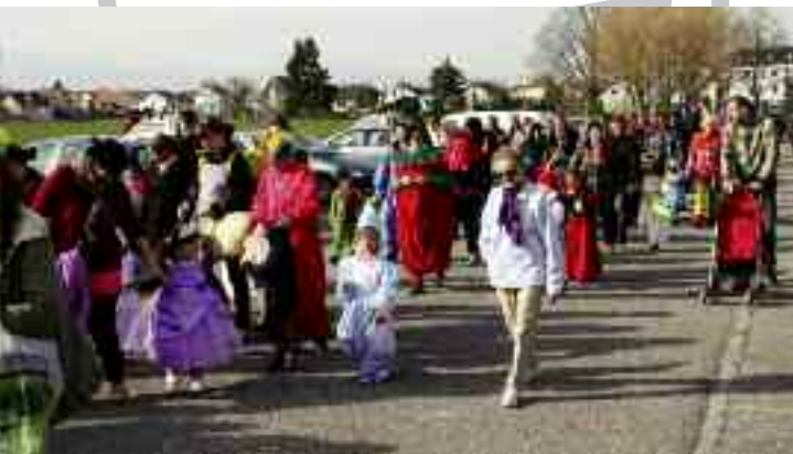
Ecoles : le 11 mars à Louise Michel, les maternelles défilaient dans les rues parés de leurs plus beaux costumes.