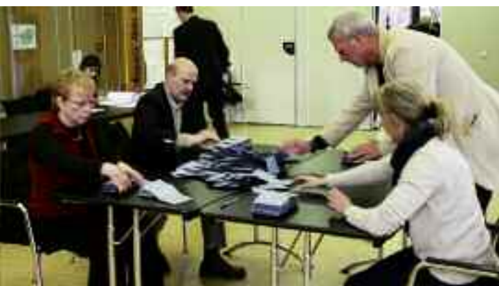
Le dépouillement des bulletins commence dans les 14 bureaux de vote en présence des assesseurs.