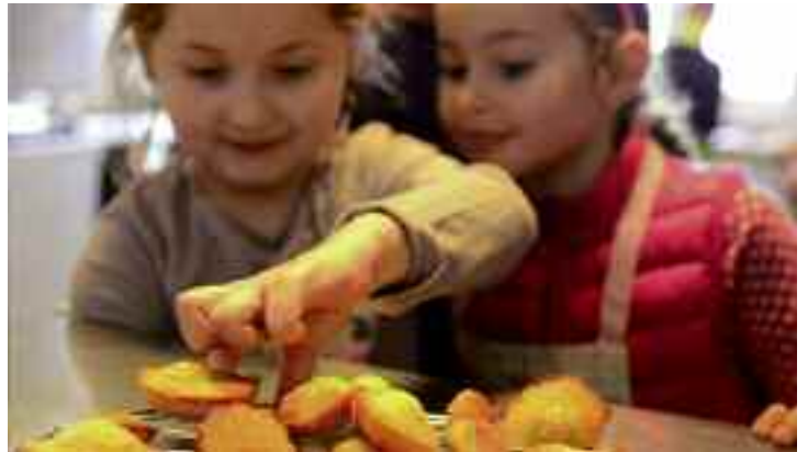
Accueil de loisirs : du 24 février au 7 mars au Créa, les enfants participaient à de nombreuses animations dont ici, un cours de confection de madeleines !