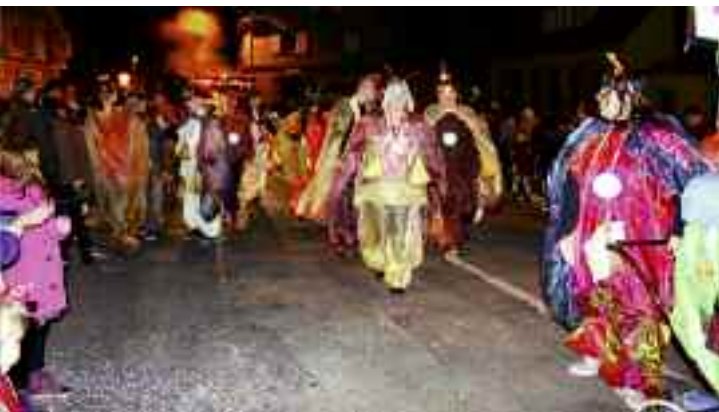
Carnaval : les 14 et 15 mars, le CCVA organisait un carnaval qui pour la première fois proposait une cavalcade de nuit. Roulements de tambours et sons de trompette ont sonné le départ d'une grande parade nocturne menée par une joyeuse bande de "carnavaliers".