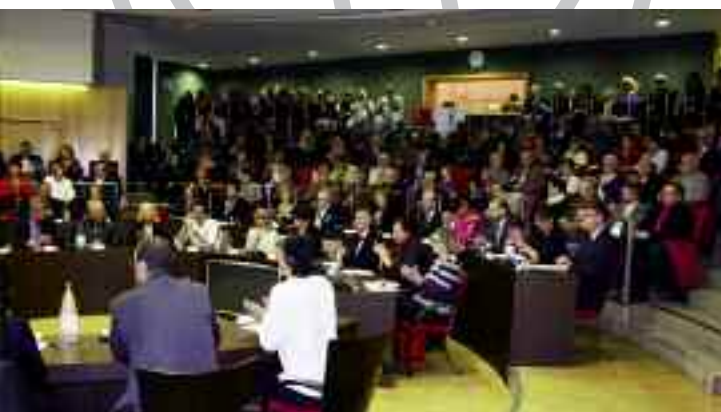
Dimanche 30 mars, une foule impressionnante assiste à la séance d'installation du nouveau Conseil municipal.