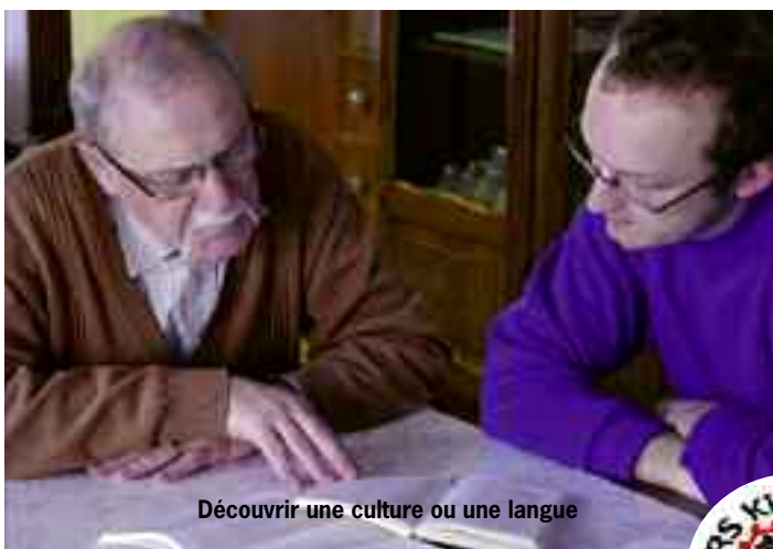
Découvrir une culture ou une langue

Pour en savoir plus, consulter le blog : rerskingersheim.blogspot.com