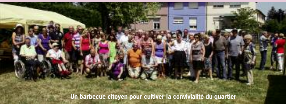
Un barbecue citoyen pour cultiver la convivialité du quartier

Renseignements : Séverine Spicacci, 03 89 57 04 87