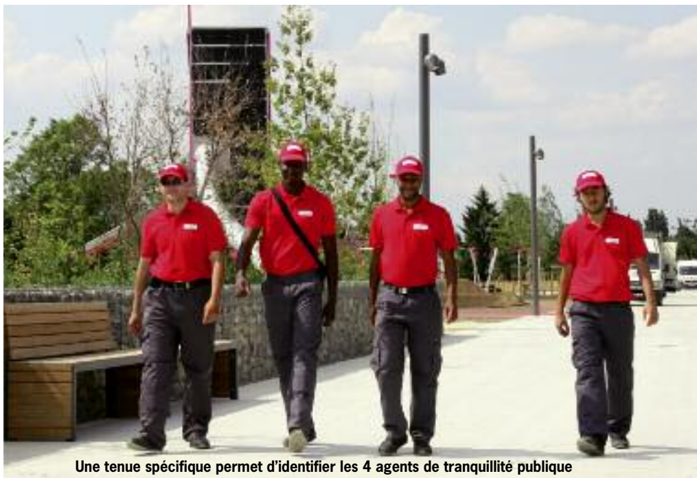
Une tenue spécifique permet d'identifier les 4 agents de tranquillité publique

Afin de garantir la pérennité du parc qui est construit en partie sur une ancienne