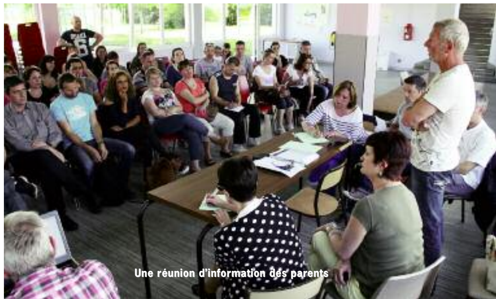
Une réunion d'information des parents

Avancer dans l'intérêt de l'enfant et avec des solutions concrètes et réalistes qui tiennent également compte des besoins des parents, c'était la priorité pour Jo Spiegel et son équipe : « En dehors de toute critique sur cette réforme de l'Education nationale qui s'impose, on doit d'abord penser à nos enfants. Le rythme d'un enfant n'est pas celui d'un adulte, il ne doit pas en être la variable d'ajustement. Longtemps, nos enfants ont été gavés comme des oies. Aujourd'hui, on leur offre une vraie chance de s'épanouir et de réussir à l'école. Nous avons su la saisir ! ». En juin dernier, le Conseil municipal a donc validé la proposition du Conseil participatif et les nouveaux horaires qui en découlent et qui s'appliqueront dans la commune à partir de la rentrée de septembre 2014. Ils sont définis sur la base d'un tronc horaire commun dans toutes les écoles : de 8h30 à 12h et de 14h à 15h45 les lundi, mardi, jeudi, vendredi et le mercredi de 8h30 à 11h30, avec des adaptations au quart d'heure près, par groupe scolaire. Un Accueil de loisirs sans hébergement sera assuré le mercredi à partir de 11h30 ce jour-là au Village des Enfants, intégrant le repas de midi .