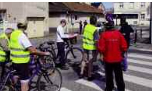
Tour de ville à vélo

L'expérience de travail au service de l'intérêt général lancée par les 6 ateliers commence à porter ses premiers fruits. Les acteurs de ces différents ateliers portant sur les thèmes " environnement et écologie ", " circulation et aménagement urbain ", " jeunesse ", " seniors ", " re-vivre ensemble ", et " fiscalité " collaborent régulièrement pour trouver les meilleures réponses possibles.