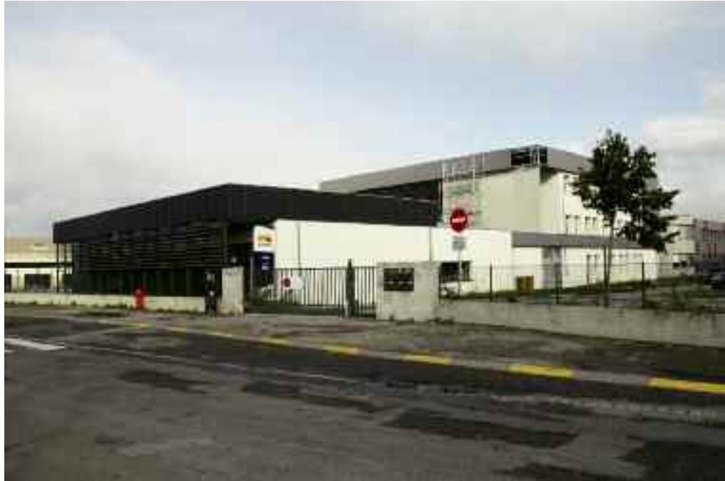
Le collège Emile Zola, un équipement moderne et performant qui se situe dans l'ère du temps

En effet, la particularité de cette opération est de regrouper plusieurs usages. Ainsi, le terrain multisports accueillera certaines des activités sportives des élèves de l'école du Centre. Le parking servira la journée aux enseignants et personnels, en soirée et le week-end aux usa-