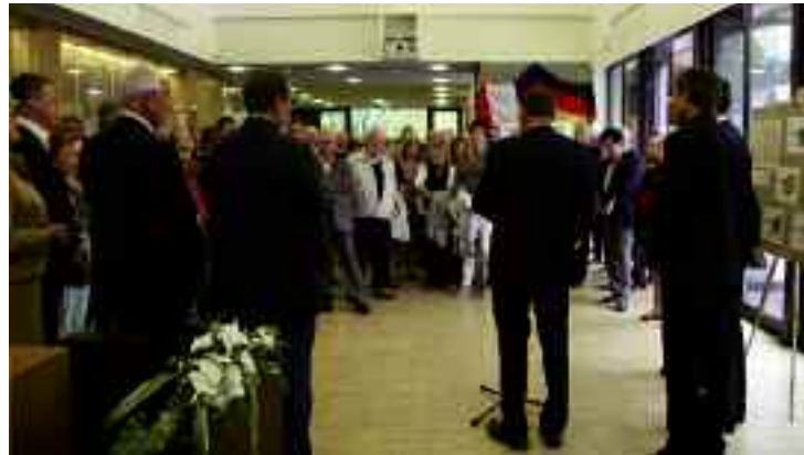
L'accueil officiel à la Maison de la Citoyenneté. La délégation allemande a pu y découvrir l'exposition proposée par la Société d'Histoire.