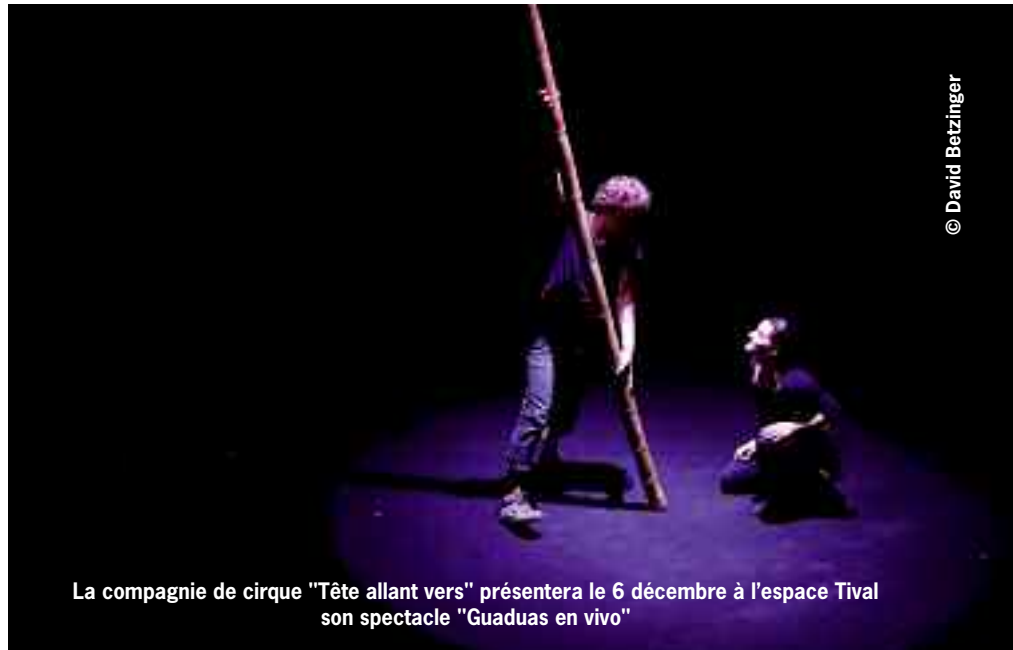
La compagnie de cirque "Tête allant vers" présentera le 6 décembre à l'espace Tival son spectacle "Guaduas en vivo"