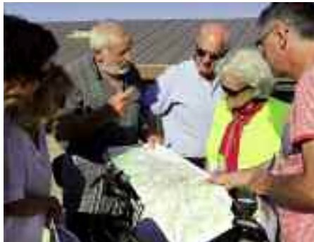
Inventaire de biodiversité

Des groupes qui sont parfois amenés à aller directement sur le terrain : c'est à vélo que l'atelier "circulation et aménagement" a parcouru la ville pour y répertorier les problèmes de sécurité routière et proposer de nouveaux aménagements qui ont été réalisés (réparation d'une balise blanche rue Picasso, pose d'une clôture de protection à la Plaine de Foot...). Une autre visite du terrain, initiée par le groupe de travail dédié à la thématique "environnement et écologie" a permis de dresser l'inventaire de la biodiversité