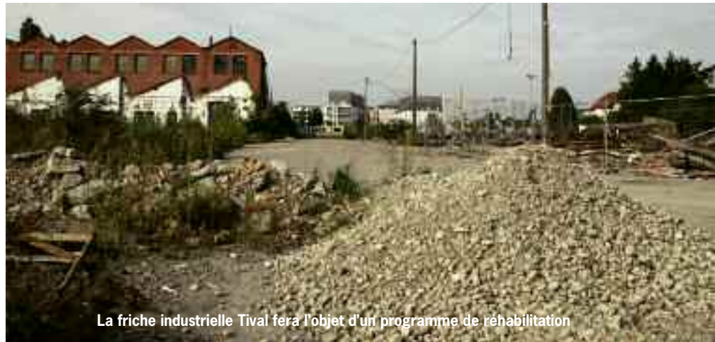
La friche industrielle Tival fera l'objet d'un programme de réhabilitation

D'après une étude de l'Insee, la taille des ménages subit une baisse ininterrompue depuis 40 ans. Il est essentiel de pouvoir continuer à construire des logements pour assurer l'équilibre entre le niveau d'équipements publics et la taille de la population. La baisse du nombre de contribuables ayant pour effet d'alourdir la pression fiscale des ménages. Soucieuse de tenir compte de cette réalité et de l'anticiper, la Ville de Kingersheim s'est appuyée sur la réflexion des habitants du conseil participatif PLU (Plan local d'urbanisme) et l'expertise d'un cabinet d'urbanisme.