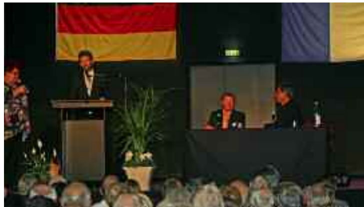
Les allocutions des élus : le discours de Boris Palmer, maire de Tübingen, a particulièrement touché l'auditoire.