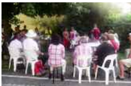
Réapprendre à se parler

Sur la thématique du re-vivre ensemble, des expériences inédites sont également menées. Toujours en été, ça n'est rien moins que le concept de réunion publique qui a été totalement revisité lors d'un apéro organisé par le groupe. La rencontre a eu lieu sur un banc public situé dans le passage Joffre, qui depuis de nombreuses années fait l'objet de tensions dans le quartier à cause de présences inopportunes. Les riverains ont été invités