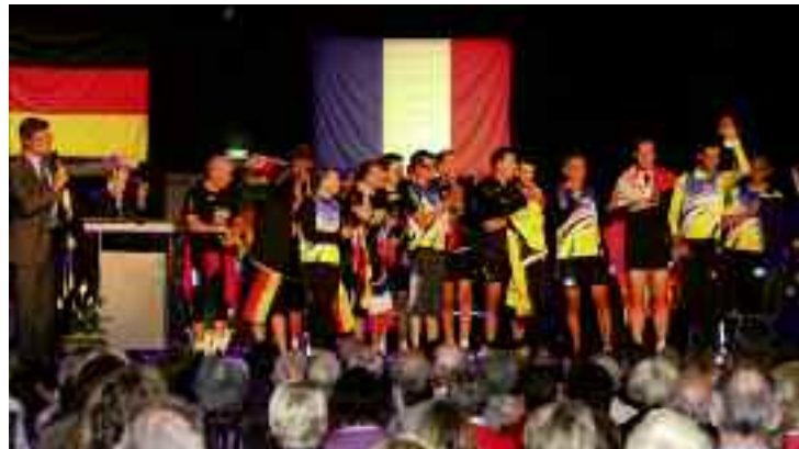
L'arrivée des marathoniens qui ont assuré un relais de Hirschau à Kingersheim.