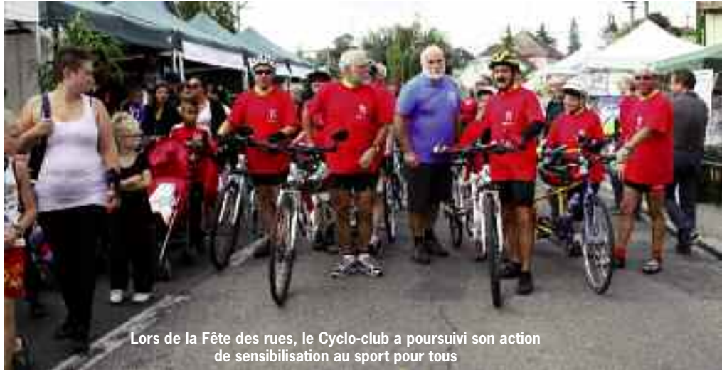
Lors de la Fête des rues, le Cyclo-club a poursuivi son action de sensibilisation au sport pour tous

Le Cyclo-club a ainsi créé une section handicap validée par son comité en janvier 2011. Elle offre aujourd'hui à des personnes atteintes d'un handicap visuel la possibilité de faire du cyclo-tourisme et de participer aux activités du club. Plus d'une trentaine de membres du CCK sont pilotes bénévoles pour accompagner lors de sorties "tandem" des personnes de la SAAM68 (Société des amis des aveugles et malvoyants) pour leur permettre de goûter au plaisir de la pratique du vélo. Le Basket-club est aussi partie prenante de