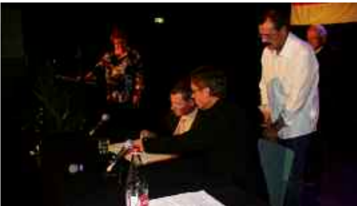
La ratification du Serment de jumelage, unissant les communes de Hirschau et de Kingersheim depuis 50 ans.