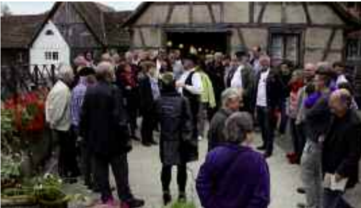
Les festivités ont débuté avec un hommage aux traditions et au patrimoine alsaciens, à l'Ecomusée d'Ungersheim.

Après les festivités commencées à Hirschau les 29 et 30 juin derniers pour célébrer le 50 ème anniversaire du jumelage, c'était au tour des Kingersheimois d'accueillir leurs amis allemands lors d'un échange qui s'est déroulé les 14 et 15 septembre et qui une fois encore, a placé très haut les couleurs de cette amitié franco-allemande de 50 ans. 300 personnes des deux pays confondus se sont retrouvées dans différents lieux de la ville pour sceller ce demi-siècle de liens de fraternité autour d'un beau programme de fête. Kingersheim Magazine vous propose un retour en images sur l'événement.