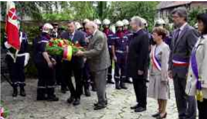
La commémoration et les allocutions officielles au Monument aux morts, avec dépôt de gerbes.