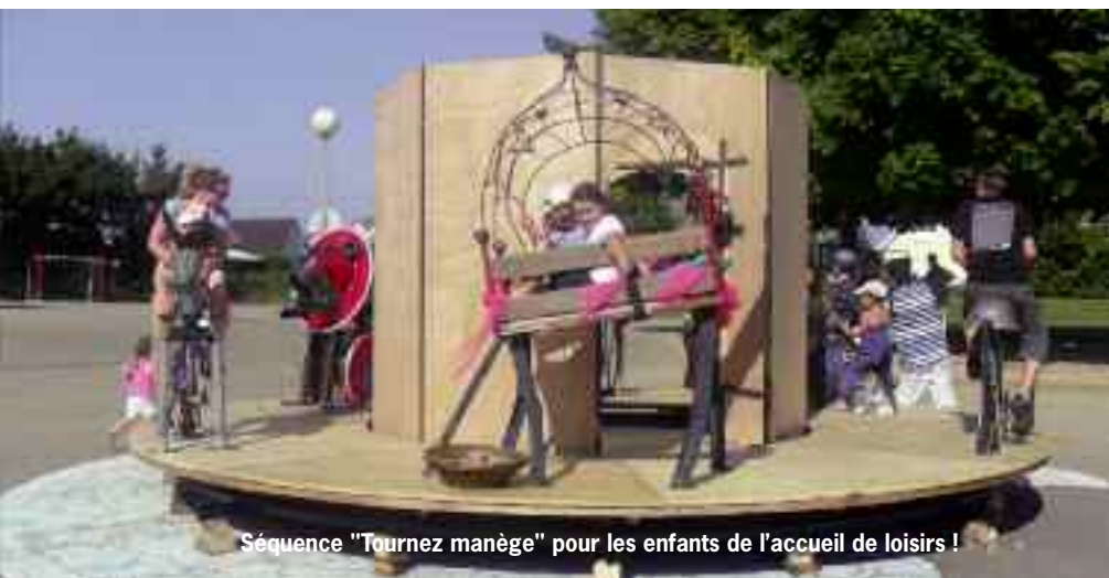
Séquence "Tournez manège" pour les enfants de l'accueil de loisirs !

L'accueil de loisirs du Créa a ouvert tout l'été. Plus de 300 enfants y ont été pris en charge tous les jours de la semaine par une vingtaine d'animateurs dont la mission était de mettre en musique les animations jeunesse de l'été.