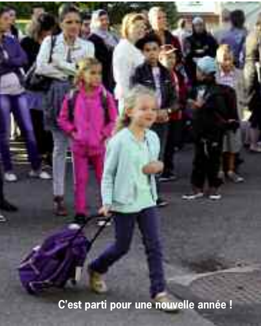
C'est parti pour une nouvelle année !

Pour la nouvelle année scolaire, 1 273 élèves sont inscrits dans les écoles de la commune. Le jour de la rentrée, tout était fait pour les accueillir dans les meilleures conditions.