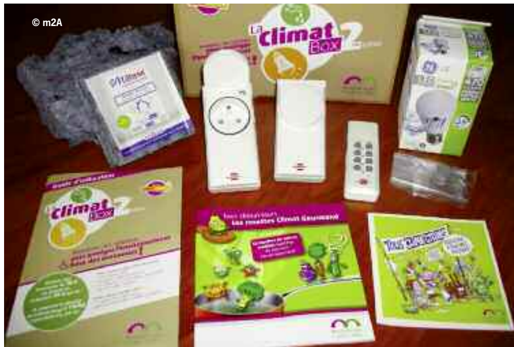
La climat box nouvelle génération est disponible à la vente en mairie

Pour ce faire, le Plan climat territorial de m2A vit localement et au quotidien grâce à une animation efficace. Un comité de pilotage transversal créé en 2006 définit les grandes orientations stratégiques tandis qu'un conseil participatif mis en place en mars 2007 élabore le plan d'actions.