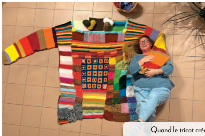
Quand le tricot crée du lien entre les générations.

Envie de passer un bon moment ? L'équipe de la médiathèque continue de proposer une belle diversité d'animations et de projets centrés sur les plaisirs de la lecture et de la création artistique. Une programmation qui plaira aux petits comme aux grands !