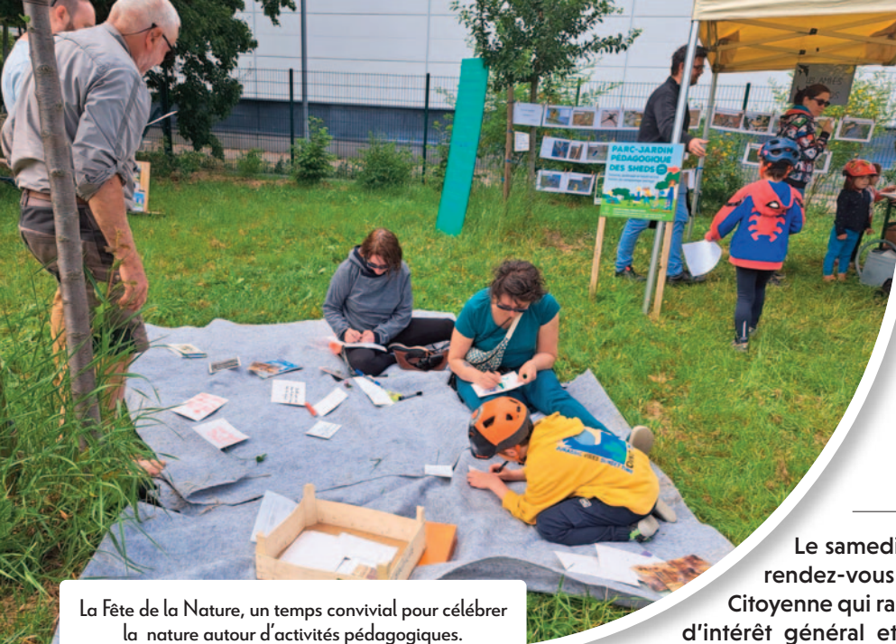
La Fête de la Nature, un temps convivial pour célébrer la nature autour d'activités pédagogiques.