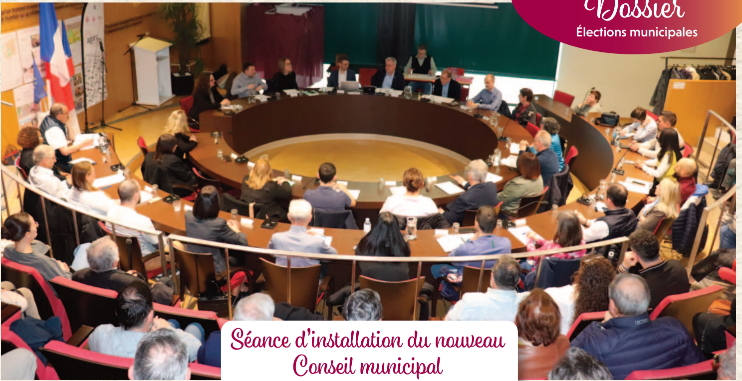
Séance d'installation du nouveau Conseil municipal le dimanche 22 mars en présence du public