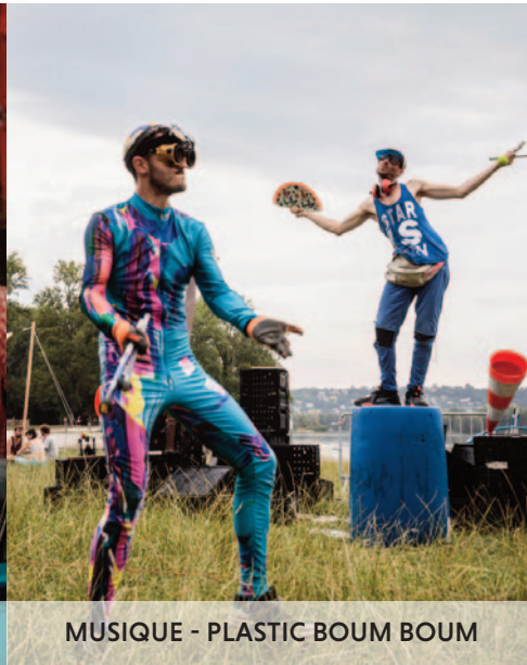
MUSIQUE - PLASTIC BOUM BOUM