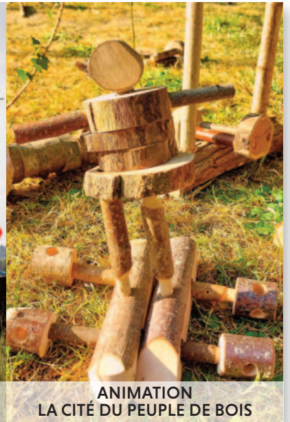
ANIMATION LA CITÉ DU PEUPLE DE BOIS