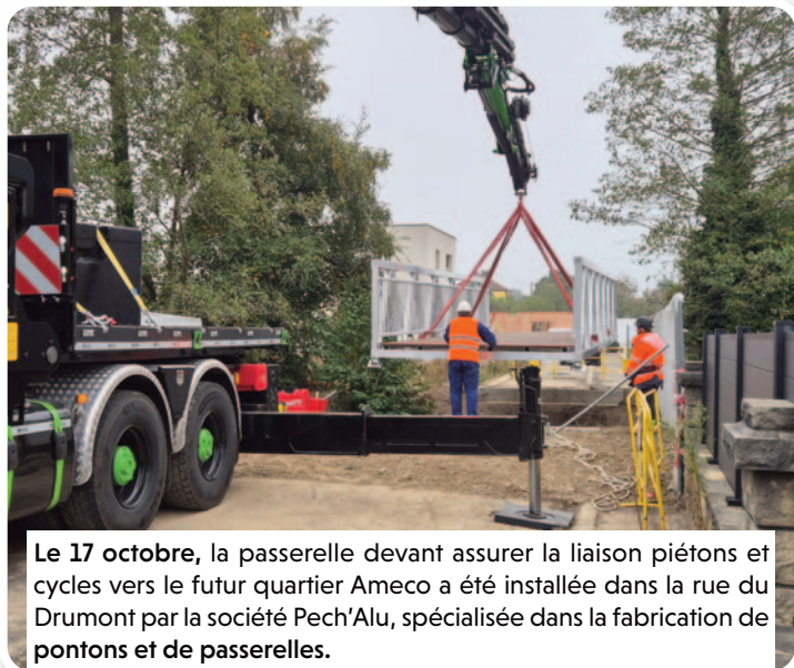
Le 17 octobre, la passerelle devant assurer la liaison piétons et cycles vers le futur quartier Ameco a été installée dans la rue du Drumont par la société Pech'Alu, spécialisée dans la fabrication de pontons et de passerelles.