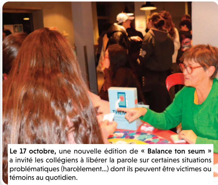
Le 17 octobre, une nouvelle édition de « Balance ton seum » a invité les collégiens à libérer la parole sur certaines situations problématiques (harcèlement...) dont ils peuvent être victimes ou témoins au quotidien.