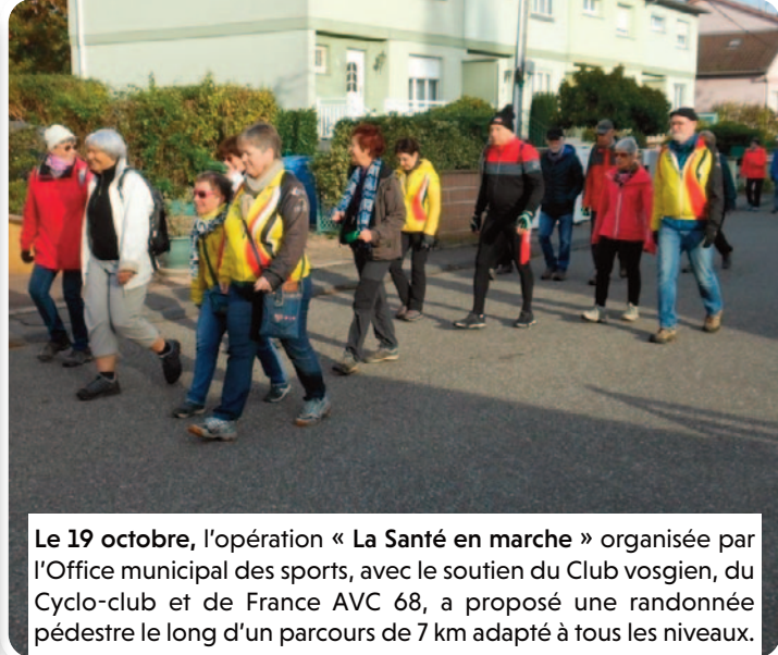
Le 19 octobre, l'opération « La Santé en marche » organisée par l'Office municipal des sports, avec le soutien du Club vosgien, du Cyclo-club et de France AVC 68, a proposé une randonnée pédestre le long d'un parcours de 7 km adapté à tous les niveaux.