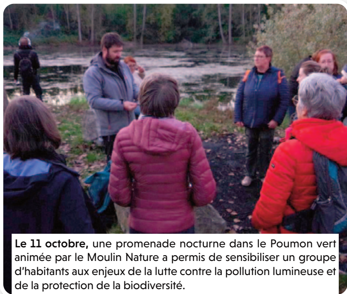
Le 11 octobre, une promenade nocturne dans le Poumon vert animée par le Moulin Nature a permis de sensibiliser un groupe d'habitants aux enjeux de la lutte contre la pollution lumineuse et de la protection de la biodiversité.