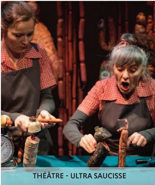
THÉÂTRE - ULTRA SAUCISSE

Du 28 janvier au 8 février 2026, la 35e édition du festival international jeune public Momix mettra sur le devant de la scène les dernières pépites produites par les compagnies artistiques françaises et étrangères réunies à Kingersheim pour faire la part belle au spectacle vivant.