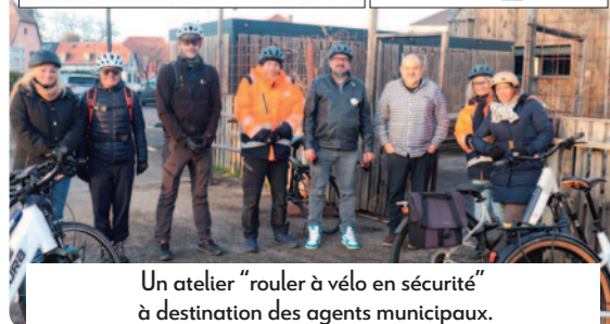
Un atelier "rouler à vélo en sécurité" à destination des agents municipaux.