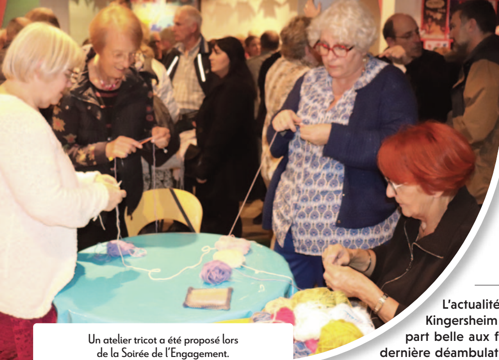
Un atelier tricot a été proposé lors de la Soirée de l'Engagement.