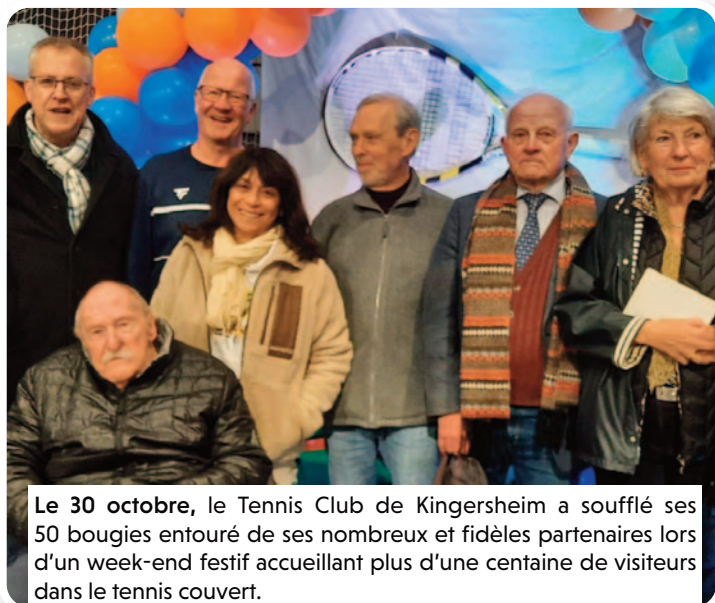
Le 30 octobre, le Tennis Club de Kingersheim a soufflé ses 50 bougies entouré de ses nombreux et fidèles partenaires lors d'un week-end festif accueillant plus d'une centaine de visiteurs dans le tennis couvert.