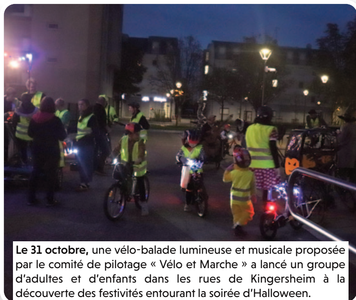
Le 31 octobre, une vélo-balade lumineuse et musicale proposée par le comité de pilotage « Vélo et Marche » a lancé un groupe d'adultes et d'enfants dans les rues de Kingersheim à la découverte des festivités entourant la soirée d'Halloween.